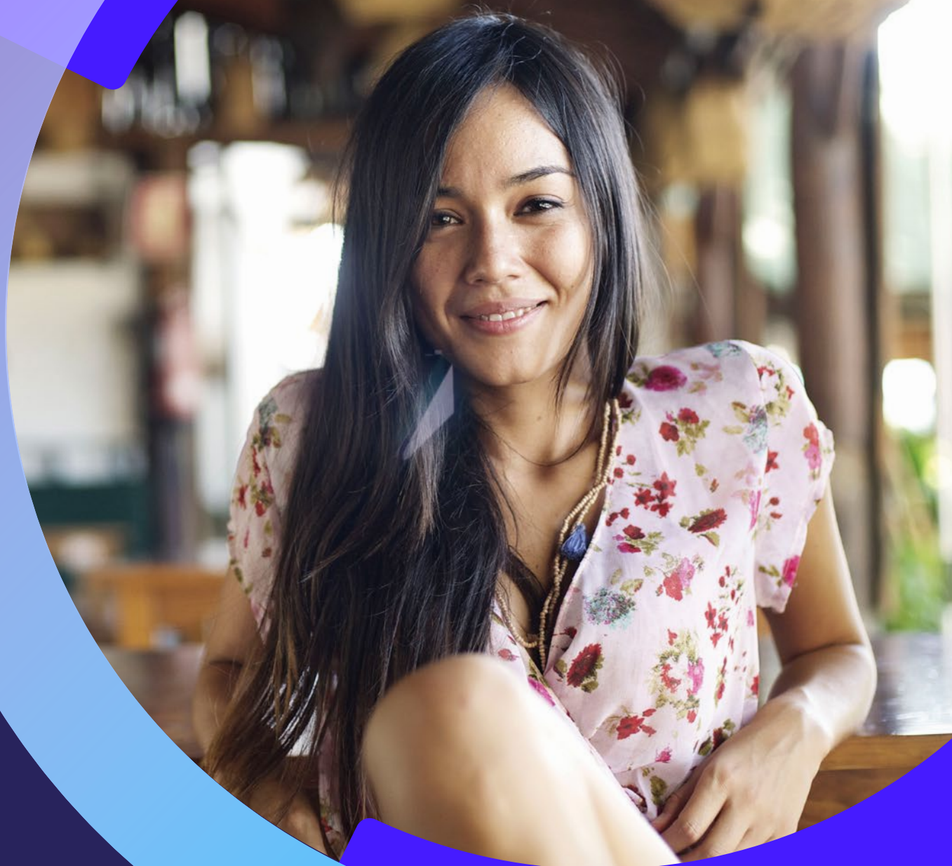
Tabela de Preços Santa Catarina

Válida a partir de 5 de novembro de 2018