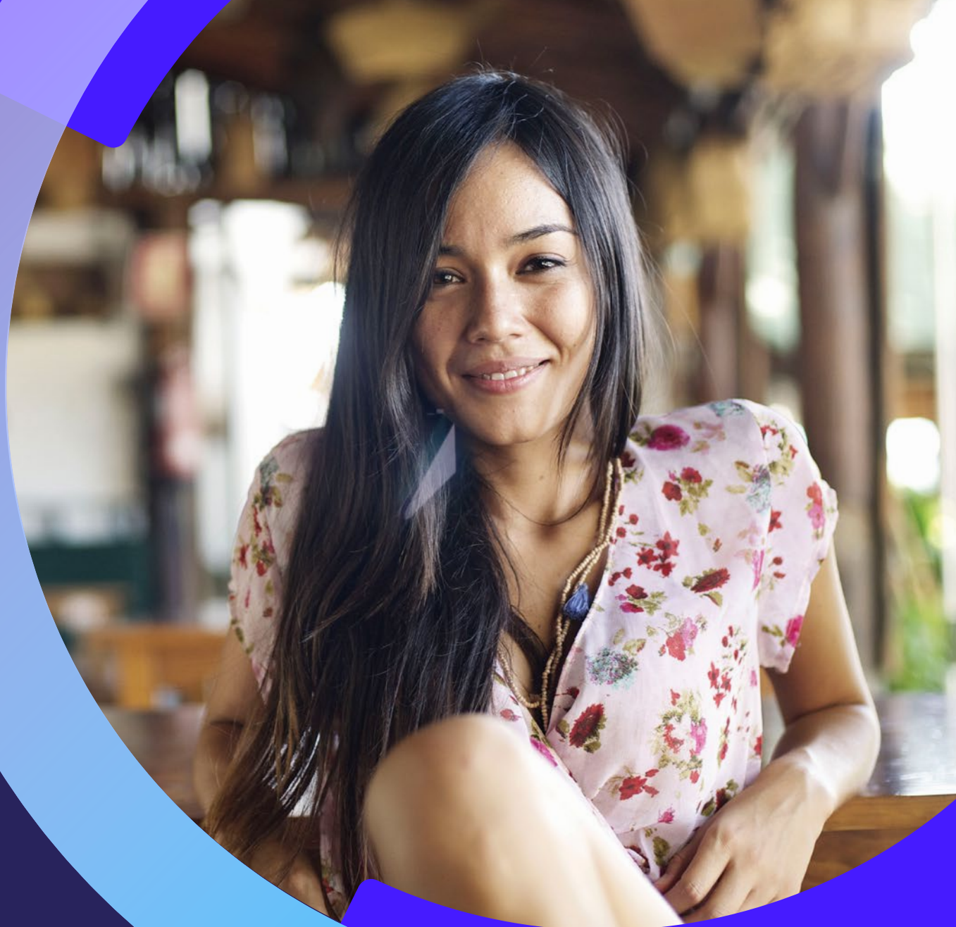
Tabela de Preços Rio de Janeiro

Válida a partir de 5 de novembro de 2018